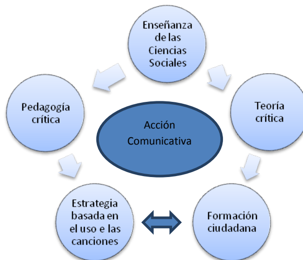
Figura 3. Marco teórico de la Estrategia Didáctica en Ciencias Sociales

Camilloni (1998, p. 185-187) afirma que las habilidades cognitivas que deben desarrollarse en relación con la enseñanza son: “La observación, la conceptualización, la resolución de problemas, la interpretación, la construcción de opiniones, la abstracción, la generalización y el análisis”.